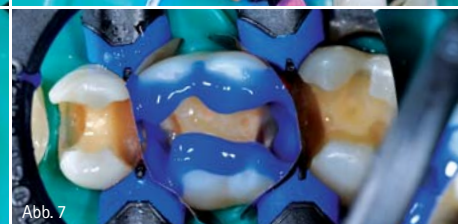
Abb. 2: Anlegen des Kofferdams nach Entfernen der kariogenen Substanz. – Abb. 3: Einmassieren von Adhese Universal mithilfe des VivaPen. – Abb. 4: Aushärten des Haftvermittlers für 20 Sekunden mit Bluephase Style. – Abb. 5 und 6: Mit nur zwei Schichten Tetric EvoCeram Bulk Fill ist die Füllung wiederhergestellt. – Abb. 7: Ätzen des Schmelzes für 30 Sekunden.