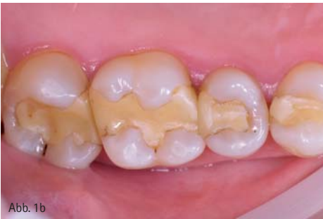
Abb. 1a und 1b: Die Ausgangssituation mit Kariesläsionen und alten Füllungen an Zahn 14 bis 17.

E in lichthärtendes Einkomponenten-System für direkte und indirekte Versorgungen ist Adhese® Universal von Ivoclar Vivadent. Das Besondere an Adhese Universal: Der Behandler kann entscheiden, ob er den Haftvermittler im Total-Etch-Verfahren, als selbstätzendes Adhäsiv oder nach einer selektiven Schmelzätzung anwendet.