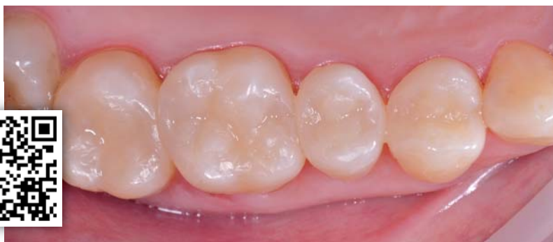
Abb. 14: Die fertiggestellten Füllungen integrieren sich nun auch mit dem Höcker- und Fissurenrelief ästhetisch in die Zahnreihe.